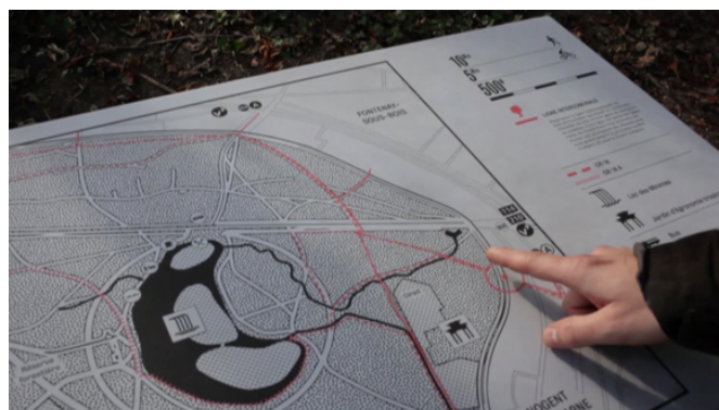
Proposition graphique pour une signalétique à travers bois