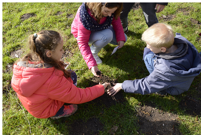
Exploration du territoire par le toucher, forêt de Guerbigny.

Nous avons proposé aux élèves d'aborder leur territoire quotidien par une première randonnée immersive, à la rencontre des milieux naturels par l'observation, l'écoute, le toucher, la cueillette et le goût.