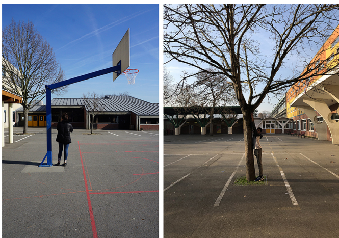
Expériences photographiques pour dimensionner la cour.