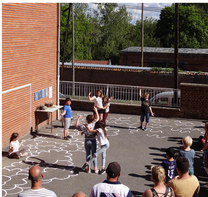
Tableau vivant dans la cour.

Nous leur demandons de faire évoluer ces tableaux au fil de nos interventions pour s'accorder aux dynamiques naturelles et saisonnières. En plus d'incarner corporellement ces milieux, ils en sont nommés les représentants pour les prochains mois : un engagement citoyen qui les responsabilise et les anime.