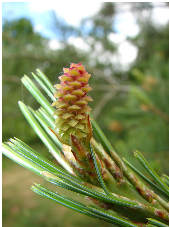
Cônelets de Pinus ayacahuite strobiformis

On peut également être charmé par les fleurs mâles et surtout les femelles. Les jeunes cônelets sont très colorés, du vert au rouge, au bleu, au violet, et peuvent prendre plusieurs années pour faire un cône mature. Ces derniers peuvent atteindre des tailles incroyables : plus de 50 cm de long pour le Pinus lambertiana Dougl. ou plusieurs kilos pour le Pinus coulteri D. Don.