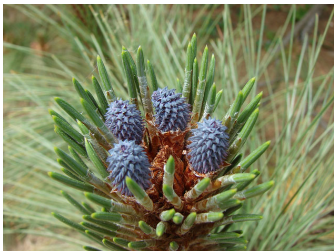
Cônelets de Pinus rudis Endl

Sur le plan olfactif, car il y en a un, qui n'a pas été charmé par la douce odeur de la litière du pin, notamment lors des chaleurs d'été ou par le moelleux si particulier aux pieds lorsque l'on se promène sur ce matelas d'aiguilles sous l'ombfrage léger de ces arbres. Quand on a vécu son enfance au bord de la mer, comme c'est le cas d'Alain, on associe aux pinèdes, la joyeuse ambiance des vacances d'été. Et depuis, que d'images encore d'arbres magnifiques, l'une des plus récentes étant celle d'un très gros pin parasol sur l'île de Porquerrolles.