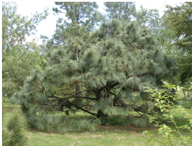
Pinus rudis Endl.