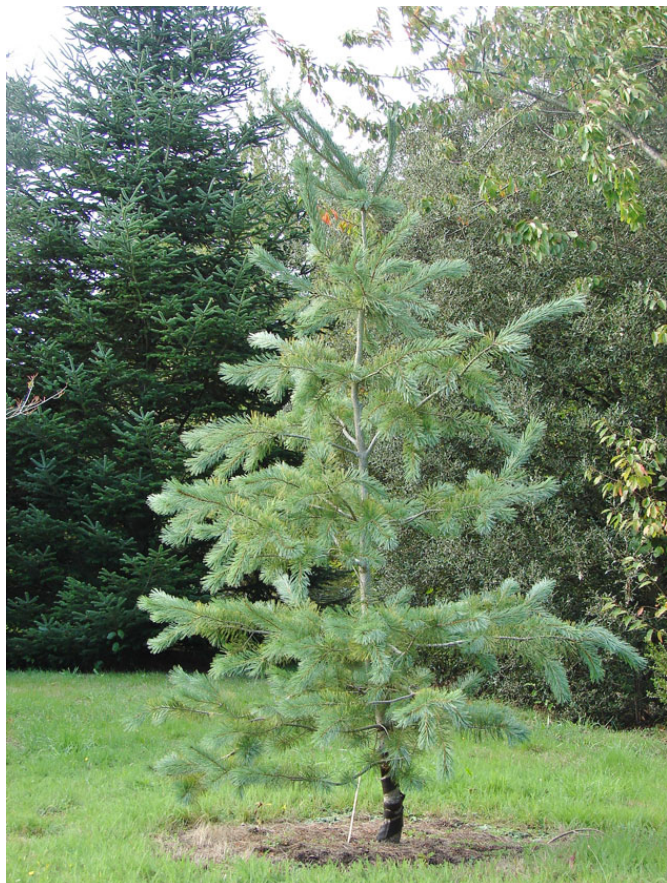
Jeune Pinus ayacahuite Ehrenb.