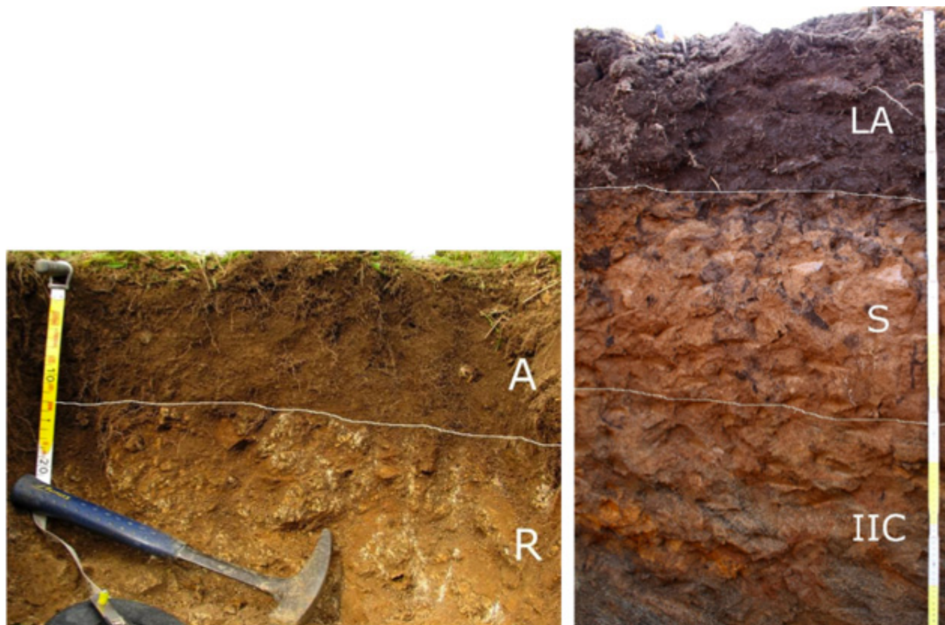
Les différents horizons du sol

et les constituants organiques d'origine végétale ou animale. Les conditions pédo-climatiques influencent l'altération de la roche en minéraux primaires puis secondaires (argiles) et la dégradation de la matière organique accumulée. Au cours de cette évolution, appelée pédogénèse, le sol d'abord superficiel s'approfondit progressivement et se différencie peu à peu en strates successives de couleur, de texture et de structure différentes appelées « horizons » et dont l'ensemble constitue le « profil ».