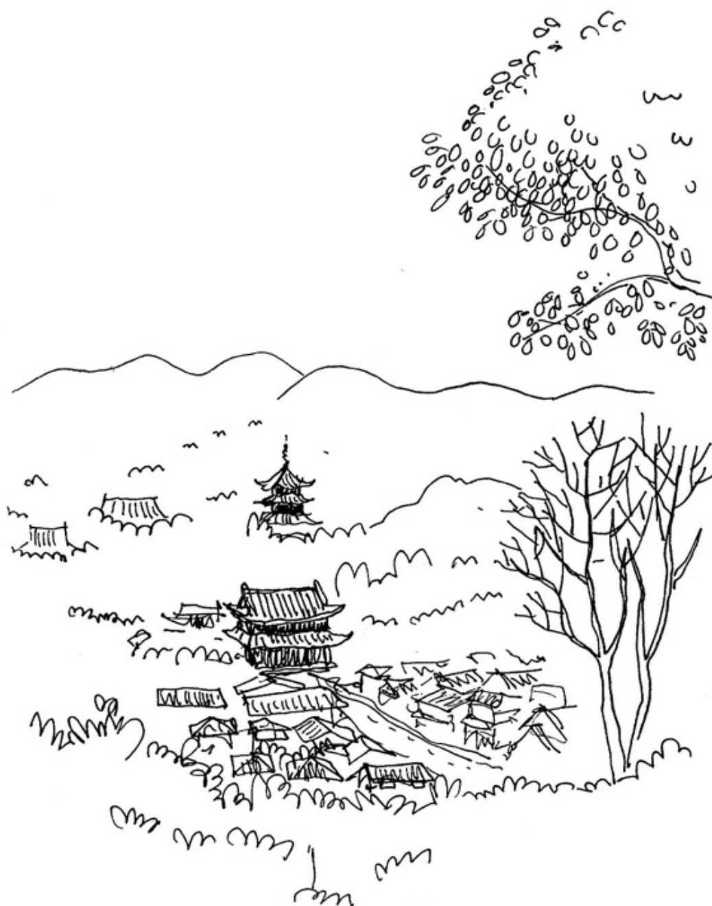
Ninna-ji, Kyoto 17.09.12