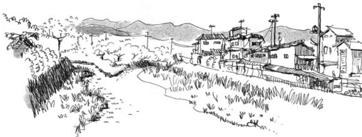
rivière Takano, non loin de Takaragike - Kyoto, 14 avril 12