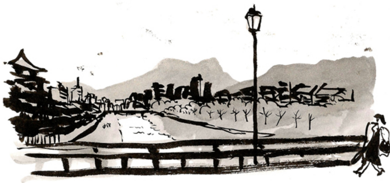
Kamogawa river, Kyoto nov 11