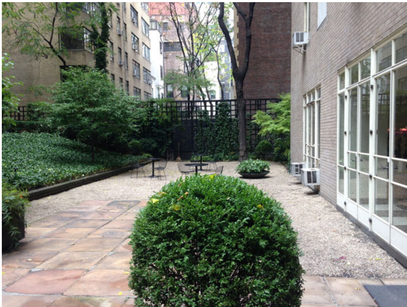
Cour plantée à New-York