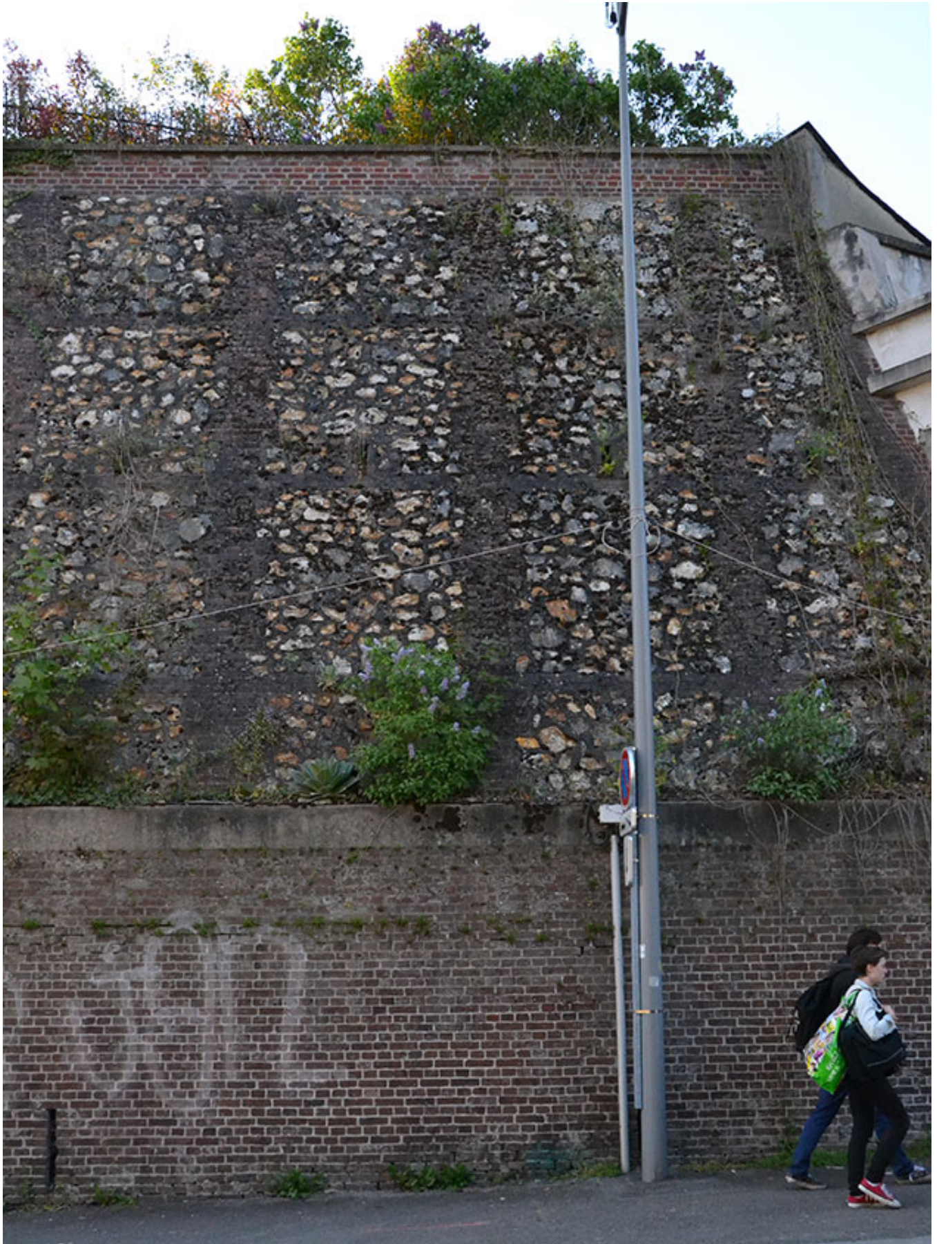
Mur de soutènement colonisé par le végétal à Rouen.