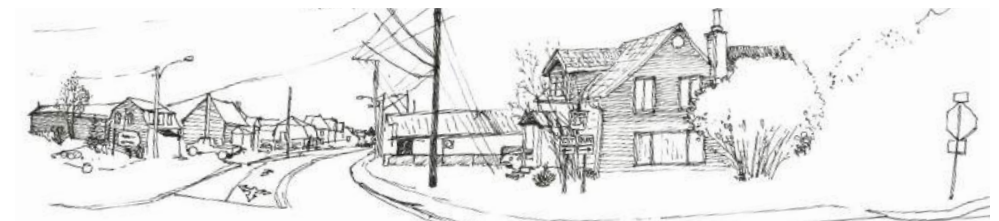
Habiter le village, quels espaces publics au coeur du village?