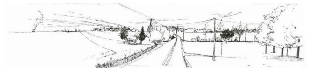
Habiter les bords, faire la liaison entre la densité et la vacuité

01.À l'Ecole Nationale Supérieure de Paysages