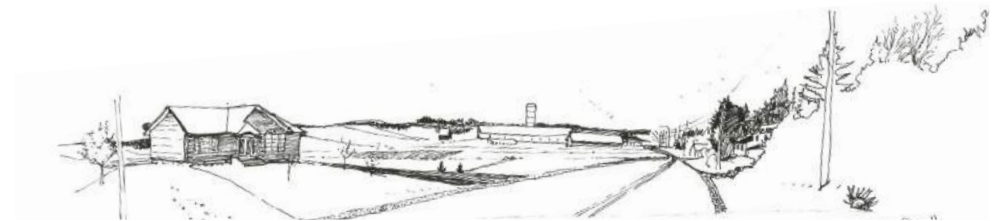
Habiter le rang, dispersion de l'habitat dans un paysage agro-forestier

Ce travail a aussi été une façon d'affiner ma vision du projet en valorisant mes compétences d'écoute et de synthèse. J'ai voulu démontrer le pouvoir préfiguratif du projet de paysage sur un territoire où les paysagistes canadiens ont beaucoup moins de prise sur le projet à échelle territoriale qu'en France.