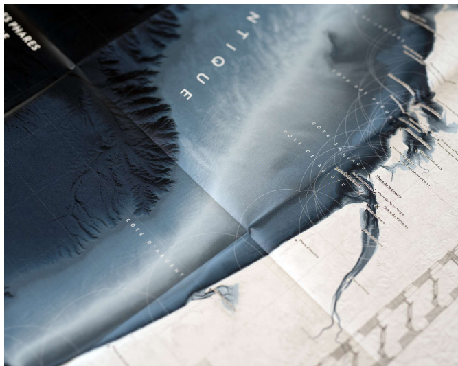
Carte des phares de la façade Atlantique, extrait © orthos logos, éditeur & cartographe 2023