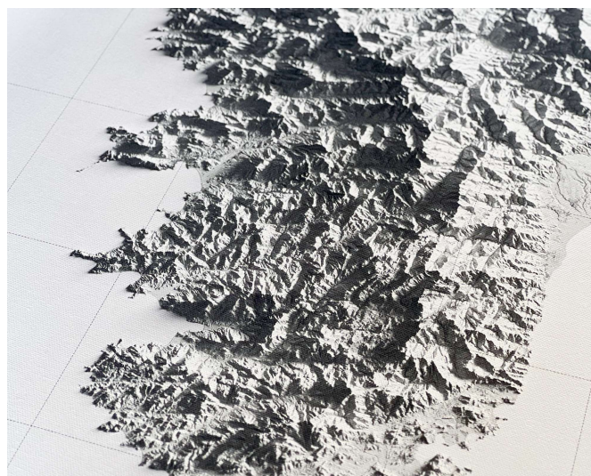
Carte relief de l'île de Corse, extrait © orthos logos, éditeur & cartographe 2023

Les Pyrénées catalanes – les Montanyas regaladas, comme on les nomme ici – encadrent ma vie. Elles m'ancrent dans une réalité finie, concrète et palpable. Elles forment un berceau ; elles m'isolent des âneries humaines. Rien de mieux que se sentir bercé par les montagnes.