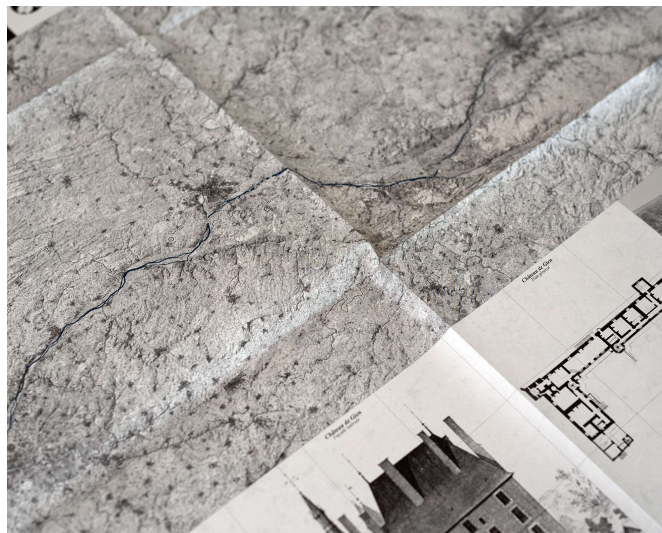
Carte des châteaux de la Loire © orthos logos, éditeur & cartographe, 2023

Vous dites aussi que si « nous façonnons le paysage, les paysages nous façonnent, que la carte dévoile ce façonnement ». Que raconte la carte de celui qui la fait ?