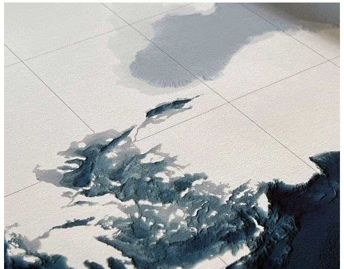
Mer Méditerranée, extrait © orthos logos, éditeur & cartographe 2023

La cartographie force à l'observation. Du moins, lorsqu'on s'y dédie sincèrement ; c'est un art ingrat pour les personnes pleines d'illusions. Afin de cartographier le territoire qu'on cherche à représenter, il faut non seulement avoir parcouru les archives disponibles – s'imprégner de ce qui précède – mais il faut également l'adosser à un travail photographique récent. Si on peut se déplacer sur place, tant mieux. Mais l'essentiel, c'est de pouvoir cerner les caractéristiques uniques ; ceux qui permettent de différencier le territoire étudié d'un autre.