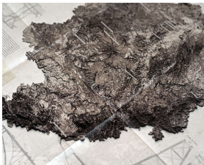
Carte des viaducs en acier du Massif central, Extrait © orthos logos, éditeur & cartographe 2023

- Elle n'a jamais encore été déroulée, dit Mein Herr ; les fermiers ont fait des objections ; ils ont dit que ça couvrirait tout le pays et que ça cacherait le soleil ! Aussi nous utilisons le pays lui-même comme sa propre carte, et je vous assure que ça marche aussi bien. »