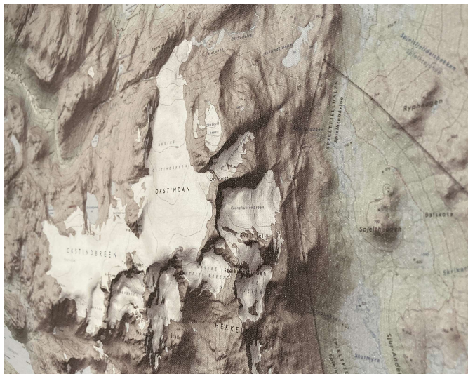
carte pour un client privé © orthos logos, éditeur & cartographe 2022