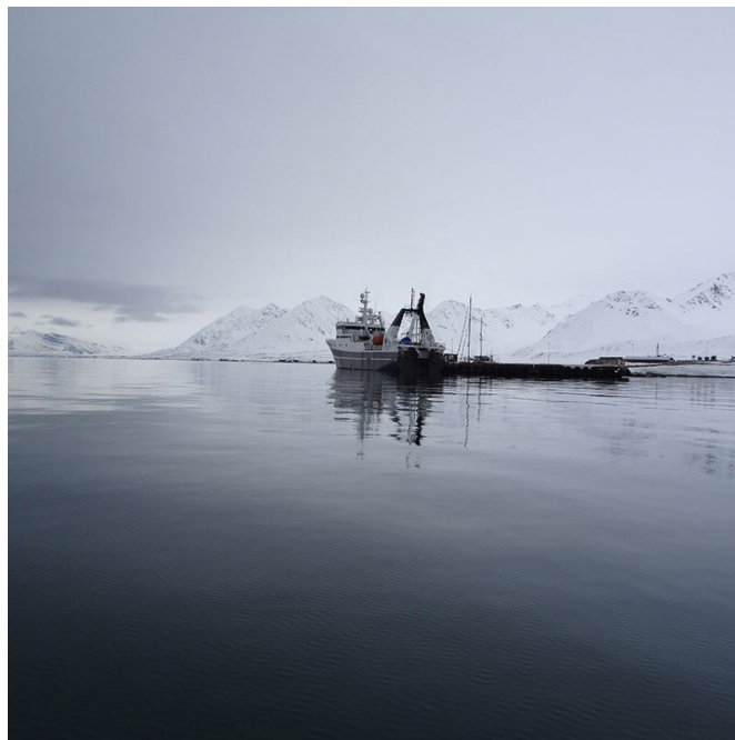
Kongsfjorden, arrivée silencieuse dans le port de Ny-Ålesund, 17/05/2019, 13h20