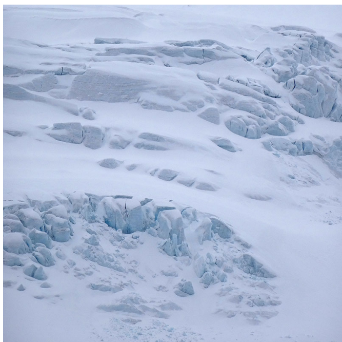
Glacier dans le détroit de Forlandsundet 17/05/2019, 12h04 Kongsfjorden, arrivée silencieuse dans le port de Ny-Ålesund, 17/05/2019, 13h20