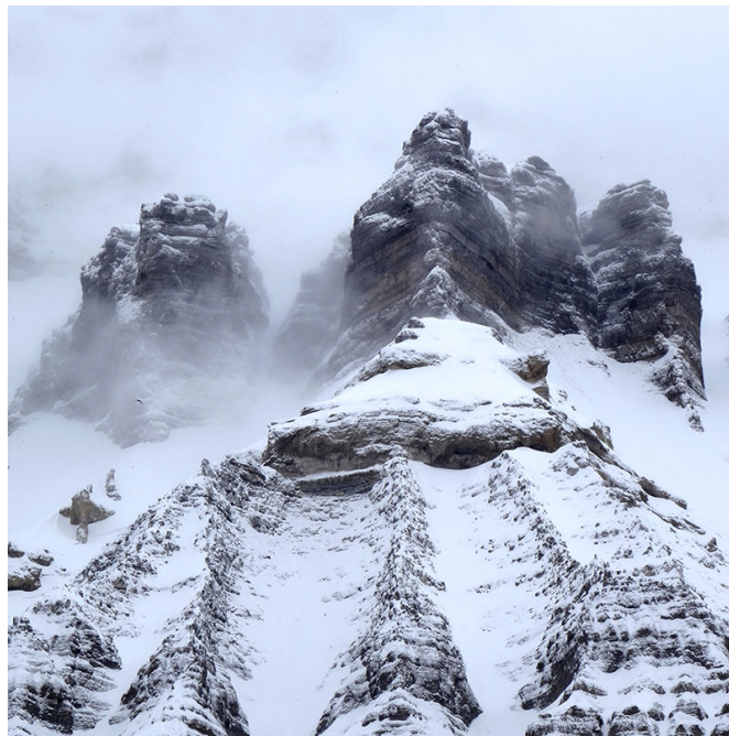
Sassenfjorden, sommets des falaises près de Diabasodden 15/05/2019, 12h12

De retour dans ma chambre, l'intensité lumineuse bat son plein malgré le ciel gris. Je tire les rideaux et allume la lampe de chevet fixée au mur afin d'avoir un semblant d'ambiance nocturne. La vive lumière du jour perce tout de même entre les rideaux.