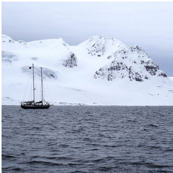
Voilier devant un glacier dans le détroit de Forlandsundet 17/05/2019, 12h02