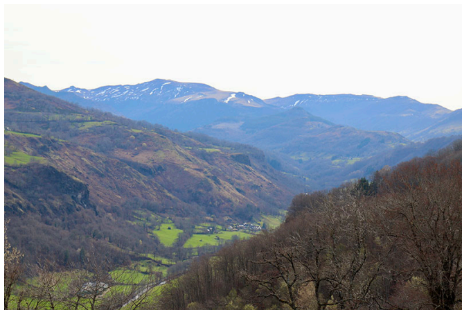
La vallée de la Maronne, reliée au parc naturel régional du Massif du Cantal.

...partir à l'assaut des reliefs, carte en main, appareil photo en bandoulière, ne faire plus qu'un avec les ressources du territoire et les retranscrire, fidèlement, sur notre dossier d'étude d'impact paysager. Ces cartographies se déploient sous kaléidoscope : PNR, MH, SPR, UP, ZPPAUP 1 ... autant d'acronymes couchés sur papier, rattachés à des documents de protection, de mises en valeur, de découpage géographique, desquelles découle une suite logique de règlements relatifs à ce paysage, que l'on imagine parfois trop immuable. Ces abréviations seront notre point de départ. Un code à venir confronter à un paysage vécu. Une réalité de terrain qui mettra en perspective le projet éolien envisagé et ses possibles conséquences.