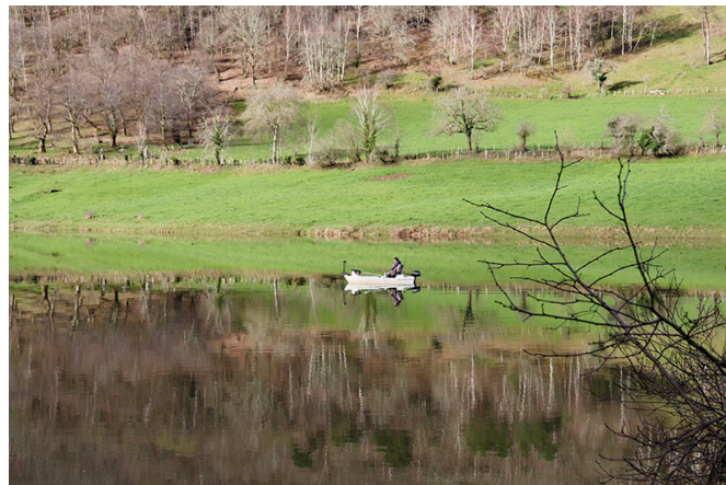
Instant pêche sur le lac.

10 h 20. L'appareil photo matraque en panoramas successifs les courtes fenêtres visuelles de la châtaigneraie cantalienne. A peine le temps de se tapisser les poumons d'une couche holorganique, que nous devons déjà grimper dans l'auto pour notre prochain point de halte : un chemin de randonnée calqué sur les circonvolutions de la Cère. Nous lorgnons sans cesse la zone d'implantation potentielle. À chaque pause, le paysagiste, être sachant, découvre finalement qu'il ne sait jamais trop bien. Les lieux s'acquittent toujours de quelques surprises, qui prennent souvent la forme de bosquets, d'accidents topographiques, de constructions absentes des cartes, de masques visuels ou de fenêtres ouvertes imprévues.