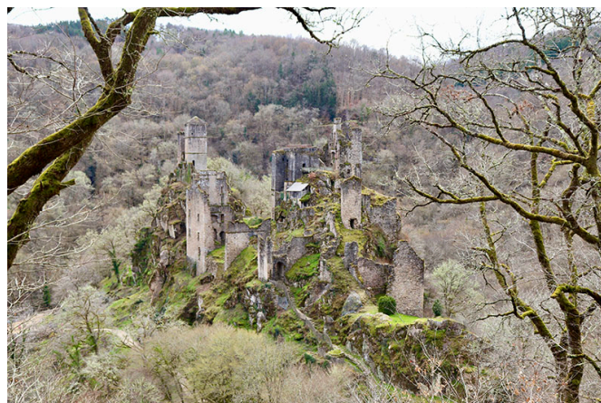
Les tours de Merle, Monument historique classé depuis 1927.

14 h 20. Nos rondes motorisées attisent la curiosité des hommes du pays, qui nous voient quadriller ce village de fond de vallée. Il est certain que la dernière photo prise des façades de la ville remonte bien à quelques décennies. Mais qui peut bien avoir l'ambition de découvrir chaque recoin de ce paysage, de la lisière du hameau, au lit du cours d'eau ? Du regard, la sentence tombe : « ils sont louches ces deux là ». Un sourire accompagné d'un timide salut viendra balayer l'angoisse de la venue du conquérant en bulldozer, tant inscrite dans le regard de l'habitant au paysage endormi.