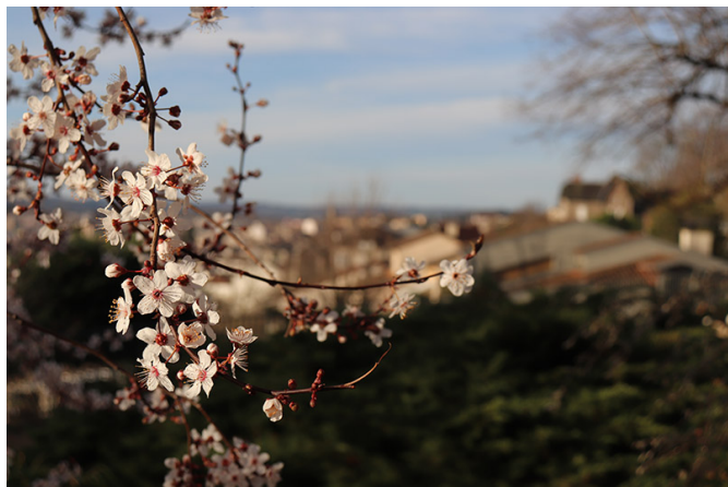
Les cerisiers en fleurs sur les hauteurs d'Aurillac, au château St-Etienne.