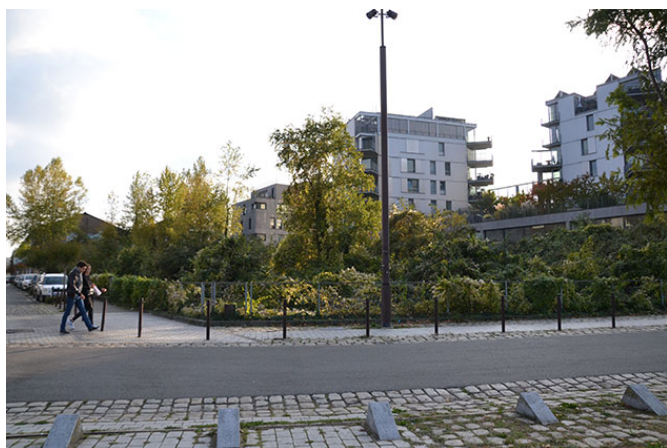
Square de l'Ile Mabon à Nantes.

La promotion des délaissés obligera les usagers à s'interroger sur les notions de « propre », de seuil et de norme. L'entretien classique des espaces verts urbains est directement issu des théories hygiénistes de la fin du 19 ème siècle et des grands principes urbanistiques qui avaient eu entre autres objectifs de rendre Paris salubre. Ceci explique en grande partie l'aversion de l'urbain pour tout brin de nature dépassant de sa plate-bande bien que cela soit remis en question depuis les années 1990. À cela s'ajoute la grande vague sécuritaire (si elle n'en est pas un dérivé) qui cherche à nous enfermer dans des bulles aseptisées. Ce même dégoût et cette peur sont de fait liés aux notions de norme et de seuil, le seuil correspondant à la limite de la norme. Historiquement, cette dernière a démontré être fluctuante et largement corrél-