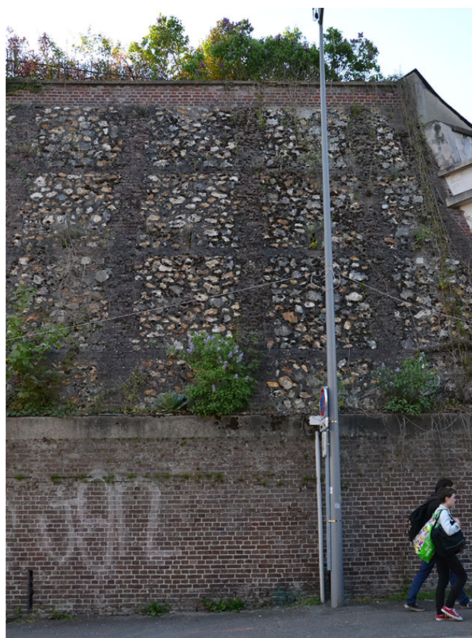
Mur de soutènement colonisé par le végétal à Rouen.

Les services écosystémiques des délaissés commencent, eux-aussi, à être étudiés. Une étude de Robinson et Lundholm (2012) menée au Canada montre que ces aires sont fréquemment aussi intéressantes que d'autres zones classiques du milieu urbain (pelouses ou espaces arborées). En outre, les provisions d'habitats et de diversité étaient plus élevées sur les espaces abandonnés (bien qu'uniquement des délaissés herbacés aient été choisis pour l'étude). Ce résultat s'explique principalement par la diversité de sols et de microclimats de ces lieux et par l'absence de perturbation, soulignant l'importance d'une mosaïque de sites aux caractéristiques différentes. Par ailleurs, les délaissés se sont montrés efficaces dans la régulation des climats urbains même s'il est évident que d'autres services écosystémiques seraient amenés à se développer par la maturation des stades de succession (infiltration des eaux pluviales, et séquestration de carbone par une végétation ligneuse).